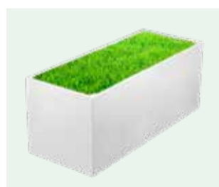
Serie K - Standard

Mit unserem Bewässerungsautomat entfällt die aufwendige Gießarbeit und selbst wochenlange Abwesenheit ist für die Pflanzen kein Problem.