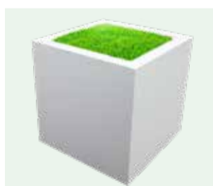
Serie K - mit umlaufendem Rand